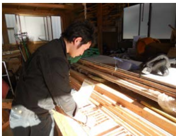
魂を込めて作成をする男