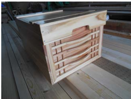
完成品 ↑ ↓